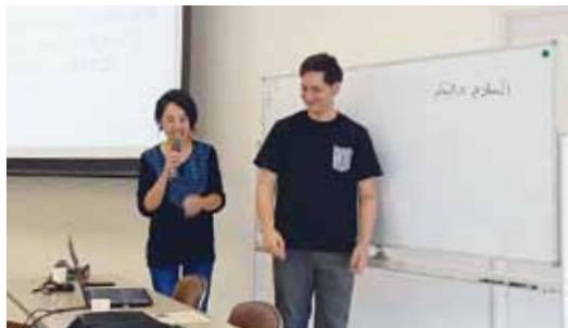
「協力隊ナビ シリアに触れる90分」のようす

★JICAでは学校現場における開発教育を推進する事業を行っています。お気軽にお問合せください。