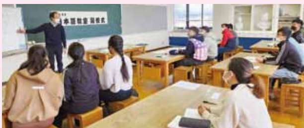
日本語教室のようす

日本人の配偶者としてこちらに来られた方の高齢化が進む中で、技能実習生が増加しています。10年後には状況がガラッと変わる可能性があるため、将来を見据えて多文化共生施策を進める必要があると思っています。