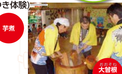
おそろね 大曾根 もちつき